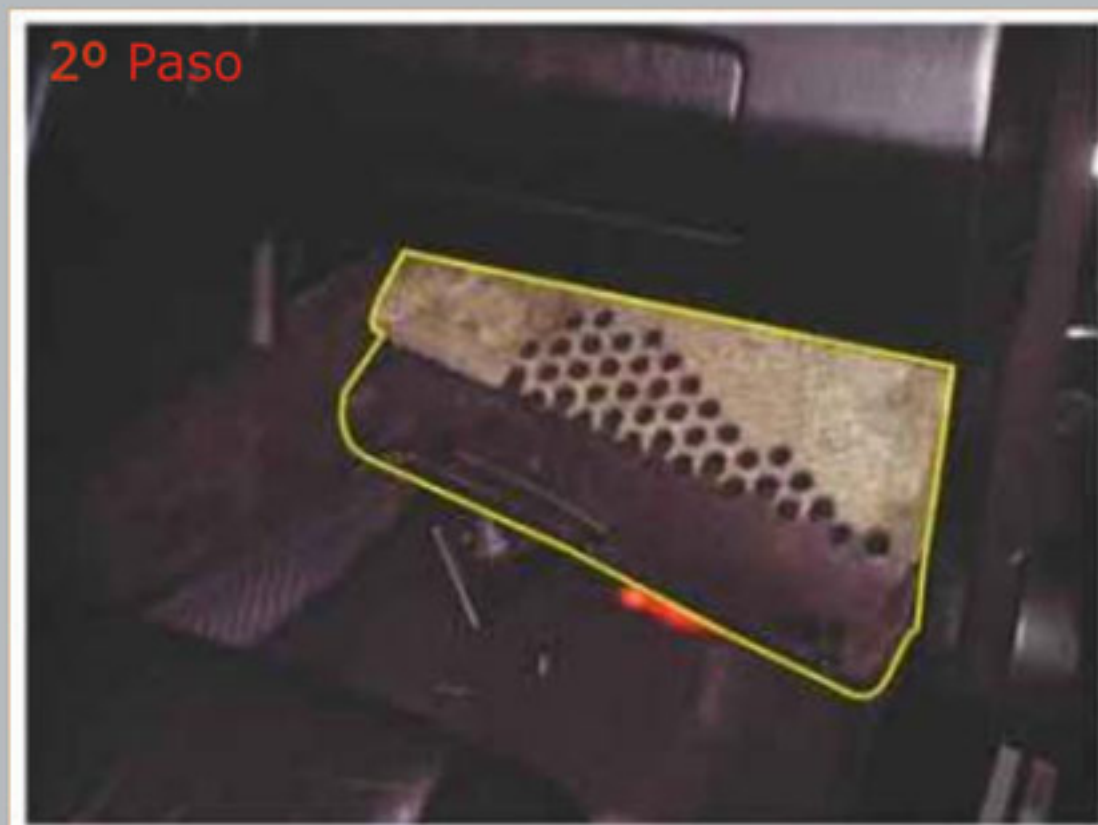
Remueva el acabado.