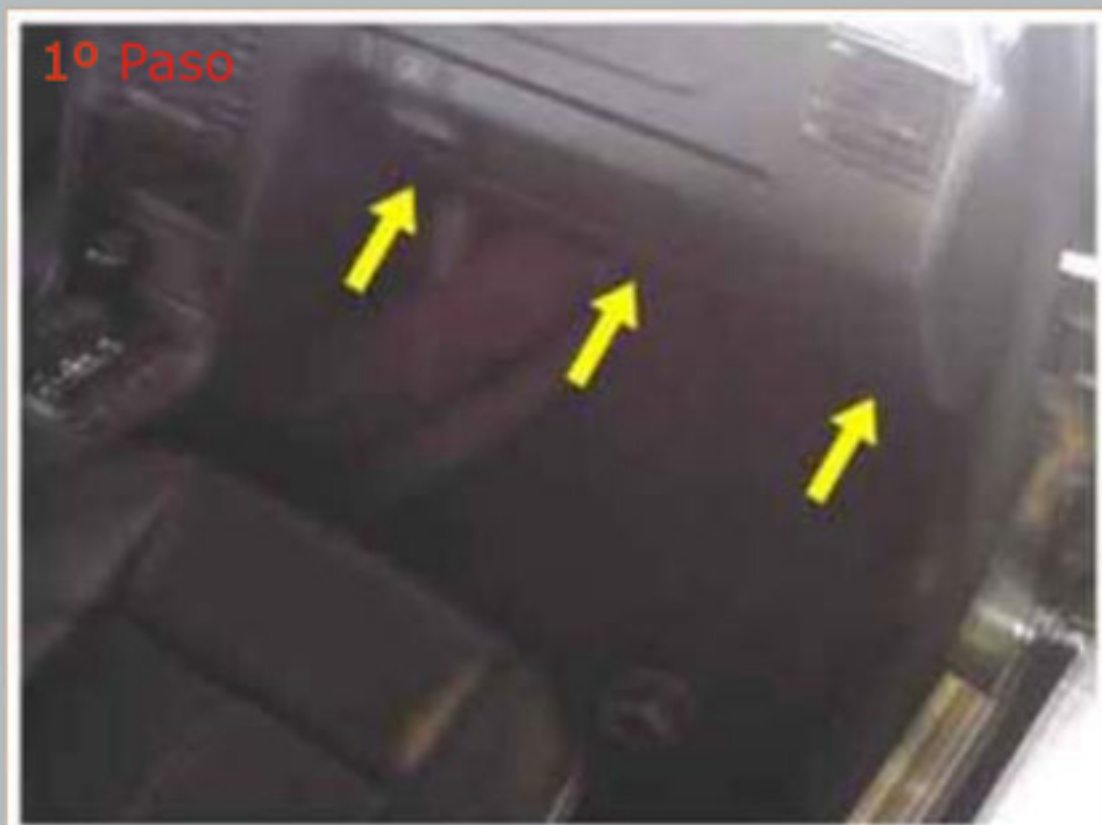
Remueva los tornillos indicados.