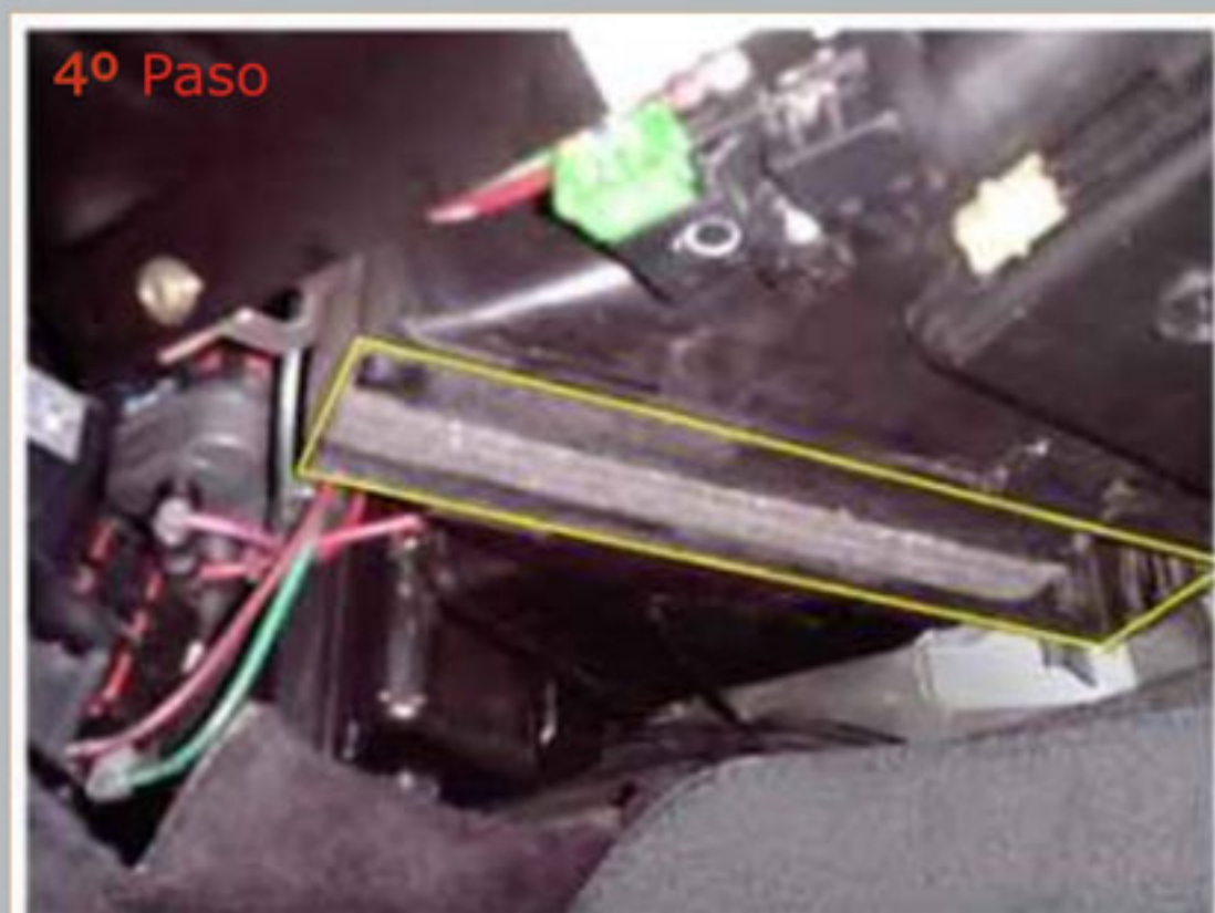
Cambie el filtro e invierta las etapas anteriores para colocarlo.